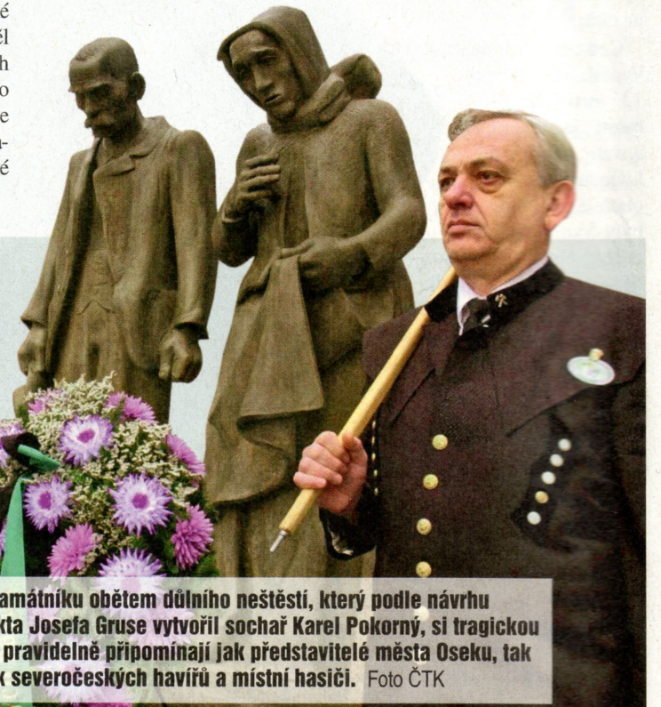
>> U památníku obětem důlního neštěstí, který podle návrhu architekta Josefa Gruse vytvořil sochař Karel Pokorný, si tragickou událost pravidelně připomínají jak představitelé města Oseku, tak i Spolek severočeských havírů a místní hasiči.