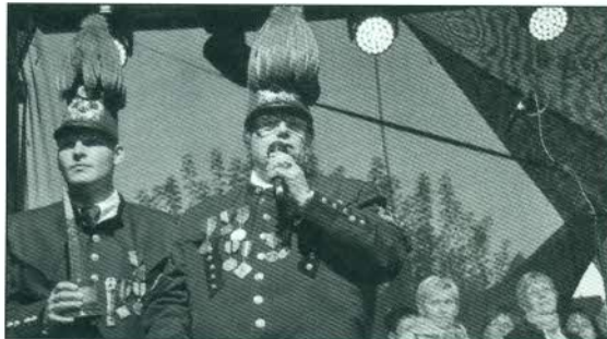
Naši přátelé ze spolku horníků při obci Stonava po převzetí ceny v kategorii 1